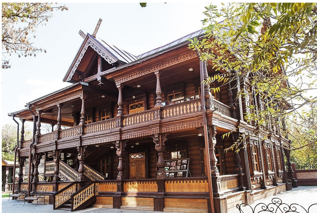
Дом купца Г.В. Тетюшинова. Фото С. Бондаря, 2013 г.

Существует мнение, что об астраханском купце Г.В. Тетюшинове и о его необыкновенном доме, не имевшем аналогов в Астрахани ни до, ни после постройки, заговорили относительно недавно – в 2010 году, в ходе и после реставрации дома. Мнение это не соответствует действительности, поскольку материалы о чудесном тереме, владельце и его семье неоднократно публиковали писатель-краевед А. Марков (1989), А. Тарков (1993–1995), О. Беломоина (2000), Л. Малунеева (2000) и многие другие.